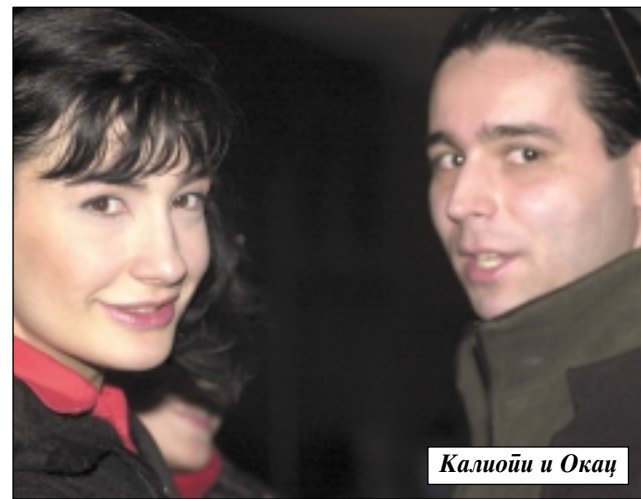
Калиопи и Ока