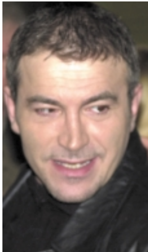
Досеџа не џреџисџавуваа Владо Јаневски и "XXL", а кој ќе биде џодинава?

со "Необичен круг", Жармена со "Сомнеж", Вера Јанковиќ-"Ветими", Лиџиџа Кочовска-"Лице и опачина", Каролина Гочева-"Од нас зависи", Марџан Николовски и "Лозена" со "Каџи ми каџи", Ана Симоновска-"Како ми е мене", Пеџе Огненов-"Саџам да сме заедно", Андриџана