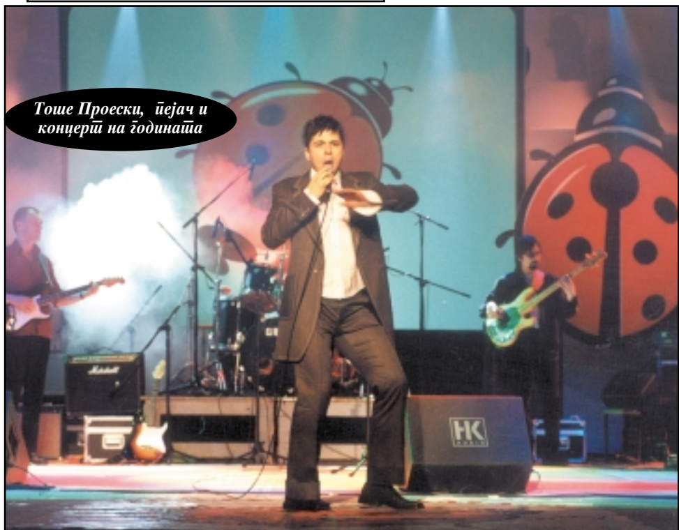
Тоше Проески, џеџач и концерт на годинаша