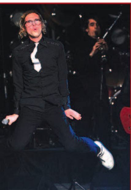
етија дека ќе напишат песна за Белов

"Јас не се снаоѓам многу кога треба да зборувам. Сè што сакам да кажам јас го пишувам во петок, а вие го читате во сабота на третата страница во "Вест", рече вчера Михајловски примајќи ја наградата.