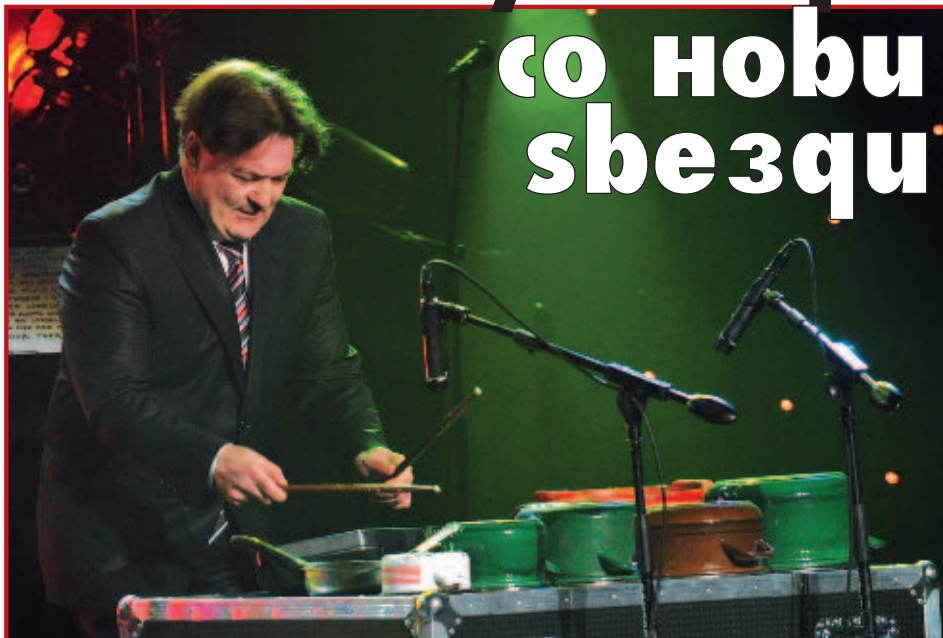
Гаро е гениј: успеа да изведе познати мелодии со сетот на тенџериња

Завчерашната "Златна бубамара на популарноста" беше уште една убава вечер со смеење и забава. Шоуто памети и подобри изданија во текот на 12-годишниот стаж. Сепак, брендот, кој се наметна како единствен од овој вид кај нас, пак ја наполни скопската Универзална сала и предизвика голем интерес и коментари меѓу публиката.