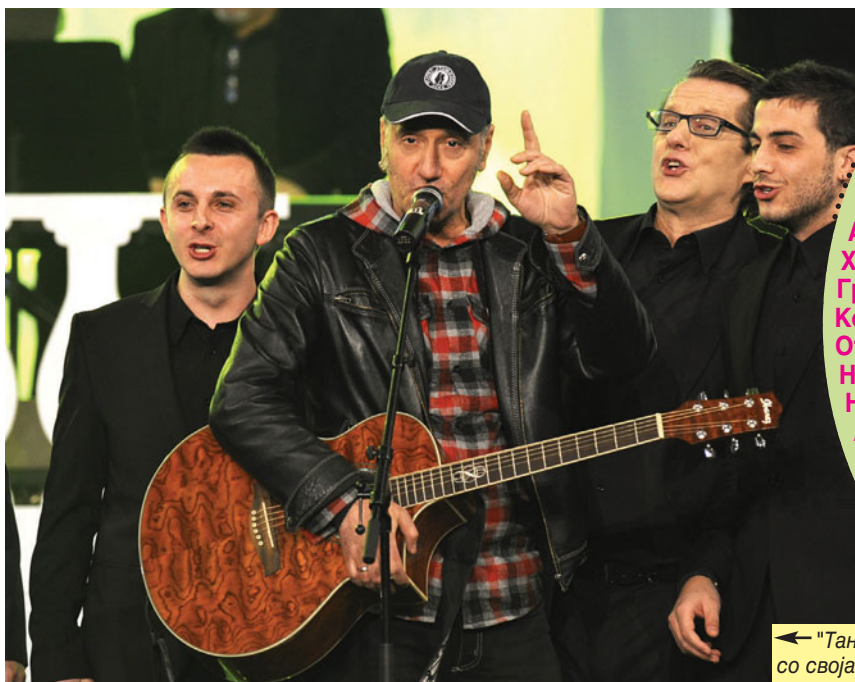
← "Танец" го пречека Влатко Стефановски со своја верзија на "Скопје"

ТВ-емисији: "Тротоар"- МТВ и "Звезкеманија" - Канал 5